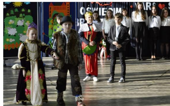
Prezentacja uczniów SP Brzezinka z okazji Święta Patrona.

W drugiej części uroczystości została otwarta wystawa „Pogrzeb ofiar obozu KL Auschwitz-Birkenau”. Scenariusz tej ekspozycji opracował Marek Książarczyk, prezes Oddziału Miejskiego Towarzystwa Opieki nad Oświęcimiem. Część prezentowanych zdjęć wykonanych po wyzwoleniu obozu pochodzi z prywatnych zbiorów rodzinnych mieszkańców Brzezinki. Przedstawiają one uro-