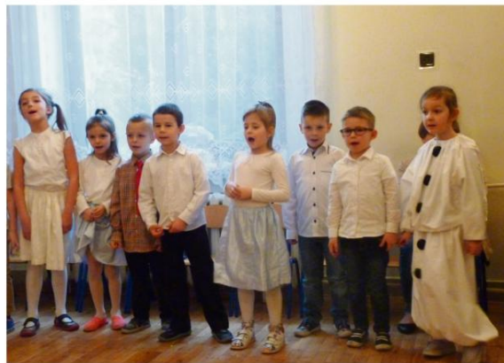
Uroczystości w Babicach.