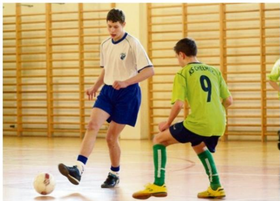
Finały powiatowych mistrzostw halowych zdominowały zespoły faworytów.

skiej gminy. Nic w tym jednak dziwnego, bo konkurencja była olbrzymia.