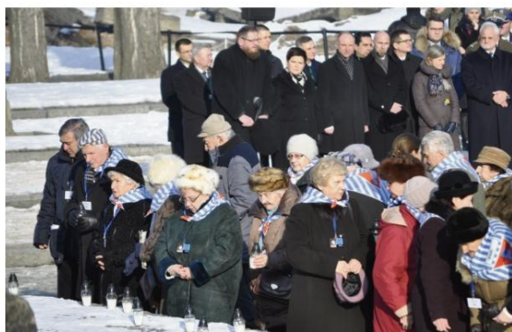
Byli więźniowie przy Pomniku Ofiar Obozu na terenie byłego Auschwitz II-Birkenau.

Po mszy odprawionej w Centrum Dialogu i Modlitwy, w południe rozpoczęły się główne obchody w budynku Sauny na terenie byłego obozu Auschwitz II-Birkenau.