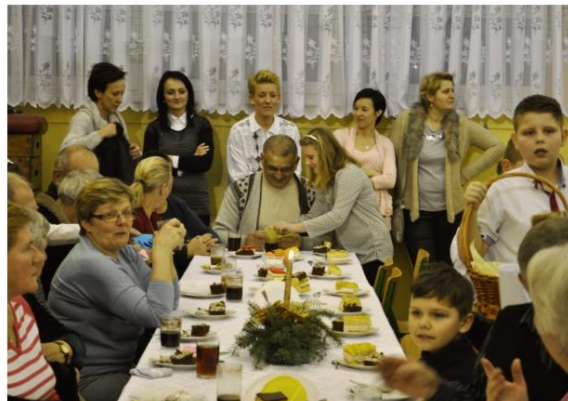
...i w Harmężach.