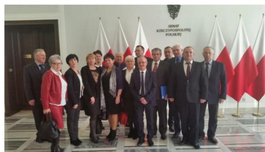
Delegacja sołtysów z powiatu oświęcimskiego.

Sołtysi z powiatu oświęcimskiego wzięli udział w konferencji "Kierunki zmian statusu prawnego sołectwa" zorganizowanej przez senacką Komisję Samorządu Terytorialnego i Administracji Państwowej we współpracy z Krajowym Stowarzyszeniem Sołtysów.