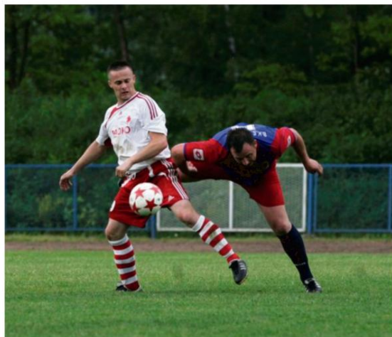
Inauguracja rundy rewanżowej w seniorskiej klasie A nastąpi 1 kwietnia.

8 kwietnia odbędą się pierwsze spotkania w pierwszej lidze juniorów starszych, gdzie wiceliderem jest LKS Rajsko ze stratą zaledwie trzech