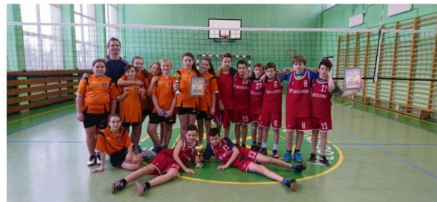
Fot. Łukasz Wabik